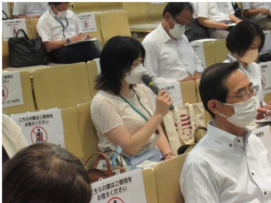
発表 ワークショップ 「公民館活動による障がい者の学び支援 ～公民館の講座（計画）を作ってみよう～」