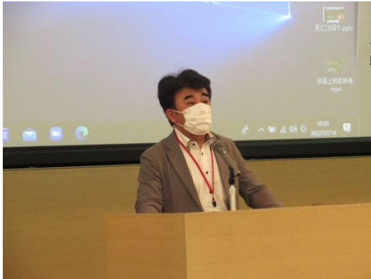
【主催者あいさつ】公民館連合会事務局次長 社会教育課 馬場課長補佐兼主任社会教育主事

新型コロナウイルス感染防止対策のため、時間を短縮しグループワークではなく、ワークシートを使って、障がいがある方もない方も「誰でも参加できる」講座について個人で検討した後、発表し情報交換を行った。