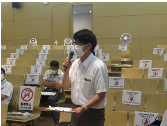
質疑・応答 講義：「秋田県・障害者の生涯学習支援モデル事業」